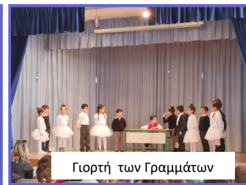
Γιορτή των Γραμμάτων