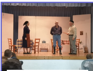
Θεατρική Παράσταση ΦΙΛΗΜΩΝ