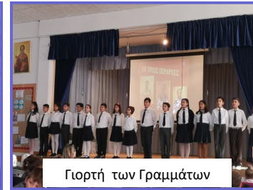
Γιορτή των Γραμμάτων