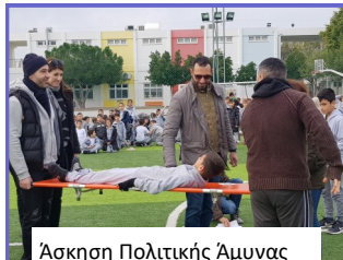
Άσκηση Πολιτικής Άμυνας