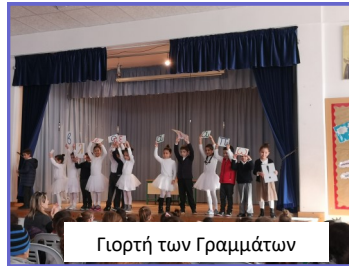
Γιορτή των Γραμμάτων