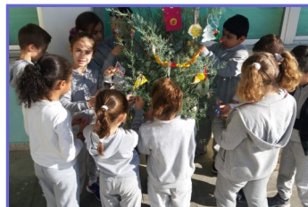
Το οικολογικό χριστουγεννιάτικο δέντρο του σχολείου μας