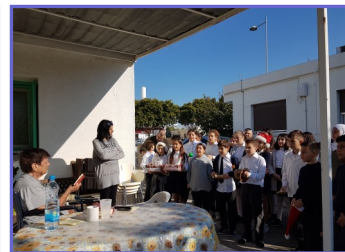
Κάλαντα στην Κοινότητα