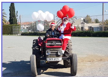
Άφιξη του Άη Βασιλή στο σχολείο μας

Στόχος είναι να δημιουργηθεί ένα βιβλίο με 13 διασκευές γνωστών παραμυθιών, που θα ετοιμάσουν τα 13 διαφορετικά τμήματα των σχολείων. Η διαδικασία επιβλέπεται σε διαφορετικά στάδια από τον συγγραφέα, ενώ αφού εγκριθεί από το Υπουργείο, το βιβλίο θα