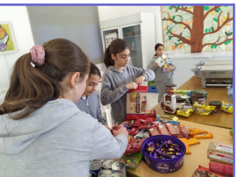
Ετοιμασία Πακέτων Αγάπης από τα παιδιά της Στ' τάξης