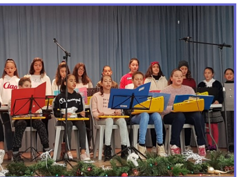
Τραγούδια από τα παιδιά της Στ' στο Χριστουγεννιάτικο Πανηγύρι του Σ.Γ.