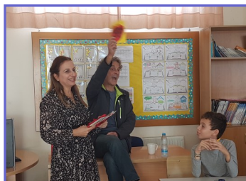
Ο συγγραφέας στο σχολείο μας