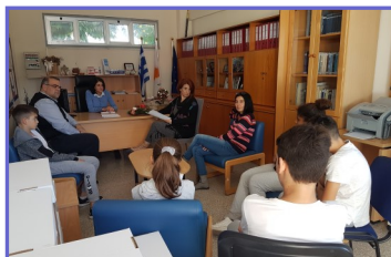
Τα παιδιά του ΚΜΣ σε κοινή συνεδρία με τη Δ/ντρια και τον Πρόεδρο του Σ.Γ.