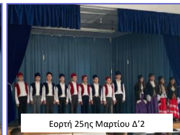
Εορτή 25ης Μαρτίου Δ'2