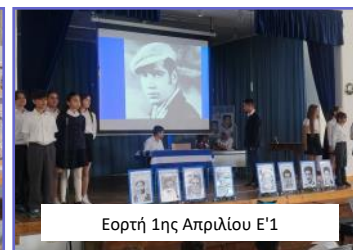
Εορτή 1ης Απριλίου Ε'1