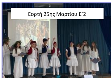
Εορτή 25ης Μαρτίου Ε'2