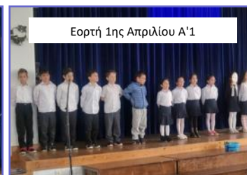
Εορτή 1ης Απριλίου Α'1