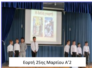
Εορτή 25ης Μαρτίου Α'2