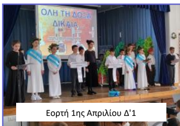
Εορτή 1ης Απριλίου Δ'1