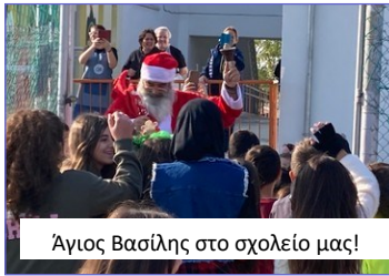
Άγιος Βασίλης στο σχολείο μας!