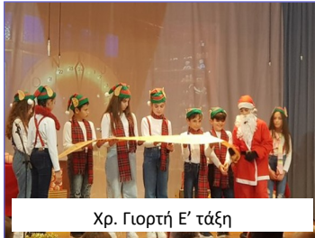
Χρ. Γιορτή Ε' τάξη