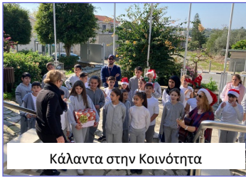
Κάλαντα στην Κοινότητα