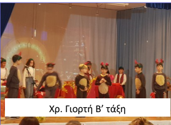
Χρ. Γιορτή Β' τάξη