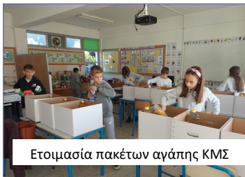
Ετοιμασία πακέτων αγάπης ΚΜΣ