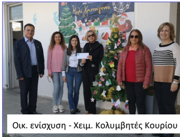
Οικ. ενίσχυση - Χειμ. Κολυμβητές Κουρίου