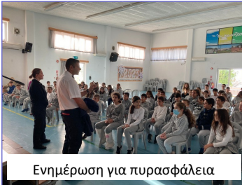
Ενημέρωση για πυρασφάλεια