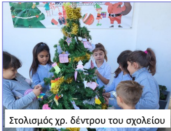
Στολισμός χρ. δέντρου του σχολείου