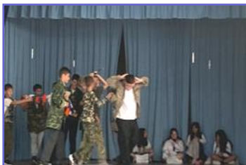
Εορτασμός 28ης Οκτωβρίου—Στ'