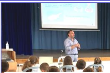
Διάλεξη—Παγκόσμια Ημέρα Τροφίμων