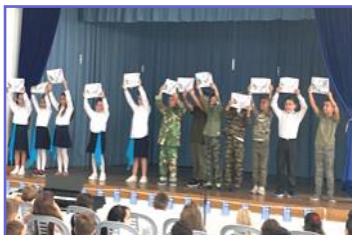
Εορτασμός 28ης Οκτωβρίου—Γ'2