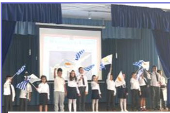
Εορτασμός 28ης Οκτωβρίου—Γ'1