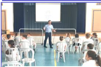
Διάλεξη για την Οδική Ασφάλεια