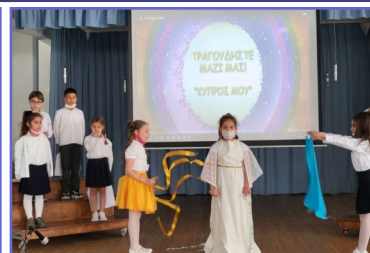
Εκδήλωση Δεν Ξεχνώ Α'