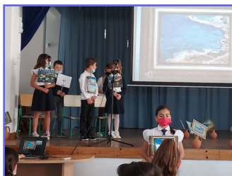
Εκδήλωση Δεν Ξεχνώ Γ'2