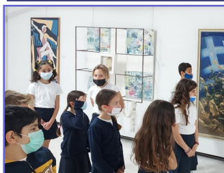
Πινακοθήκη Λ/σου Δ'2