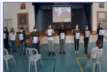
Εκδήλωση Δεν Ξεχνώ Στ'2

ΔΗΜΟΤΙΚΟ ΣΧΟΛΕΙΟ ΕΡΗΜΗΣ – ΠΑΝΙΚΟΥ ΧΑΤΖΗΧΑΜΠΗ (ΕΝΙΑΙΟ ΟΛΟΗΜΕΡΟ)