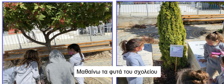
Μαθαίνω τα φυτά του σχολείου