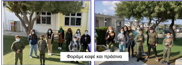
Φοράμε καφέ και πράσινα