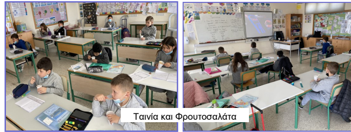
Ταινία και Φρουτοσαλάτα