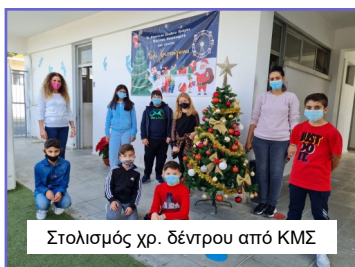
Στολισμός χρ. δέντρου από ΚΜΣ