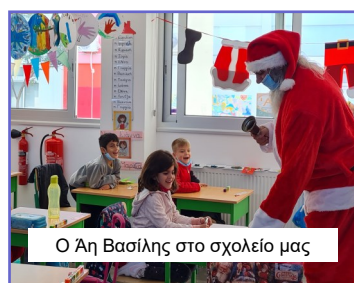
Ο Άη Βασίλης στο σχολείο μας

ΔΗΜΟΤΙΚΟ ΣΧΟΛΕΙΟ ΕΡΗΜΗΣ – ΠΑΝΙΚΟΥ ΧΑΤΖΗΧΑΜΠΗ (ΕΝΙΑΙΟ ΟΛΟΗΜΕΡΟ)