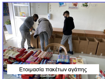
Ετοιμασία πακέτων αγάπης