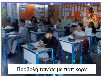
Προβολή ταινίας με ποπ κορν