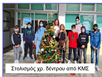
Στολισμός χρ. δέντρου από ΚΜΣ