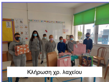
Κλήρωση χρ. λαχείου