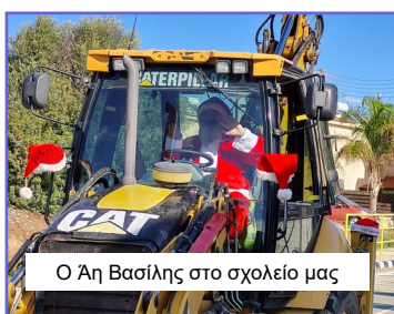
Ο Άη Βασίλης στο σχολείο μας