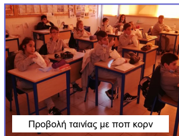
Προβολή ταινίας με ποπ κορν