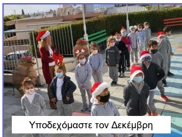
Υποδεχόμαστε τον Δεκέμβρη