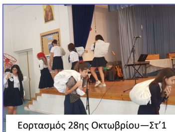
Εορτασμός 28ης Οκτωβρίου—Στ΄1