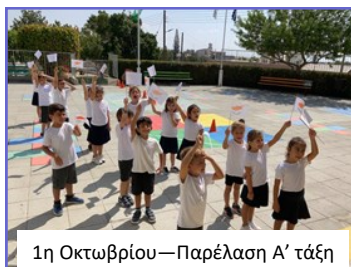
1η Οκτωβρίου—Παρέλαση Α΄ τάξη