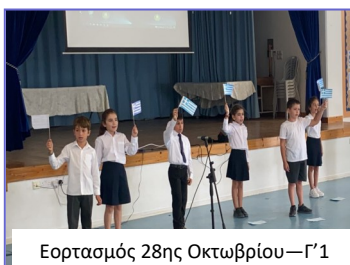
Εορτασμός 28ης Οκτωβρίου—Γ΄1