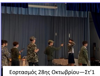
Εορτασμός 28ης Οκτωβρίου—Στ΄1