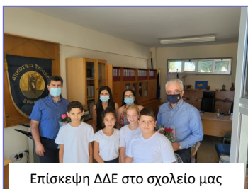
Επίσκεψη ΔΔΕ στο σχολείο μας