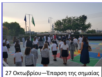
27 Οκτωβρίου—Έπαρση της σημαίας