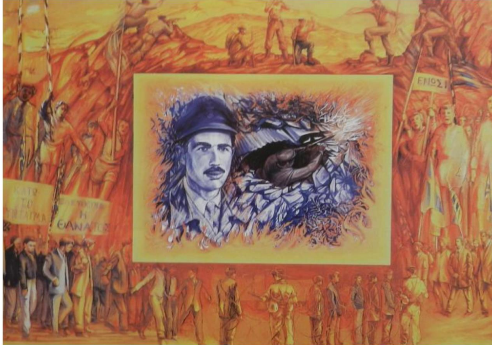
Ανδρέας Εφυσόπουλος, «Το ολοκαύτωμα του Γρηγόρη Αυξεντίου», Λάδι σε καμβά, 160X120 εκ.

Μέσα – Υλικά: Χαρτί, μαρκαδόροι, χρωματιστά μολύβια, νερομπογιές, λαδοπαστέλ, γόμα, τυπωμένες εικόνες από περιοδικά και από το διαδίκτυο.