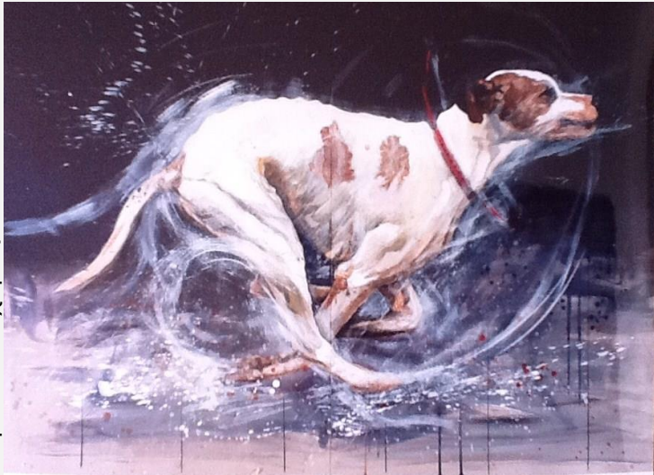
Γιώτα Ιωαννίδου, «Σκύλος Δρομέας» Ακρυλικό σε χαρτί, 2000