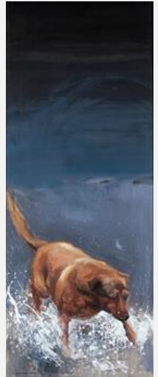
Γιώτα Ιωαννίδου, «Σκύλος» Ακρυλικό σε χαρτί, 2000