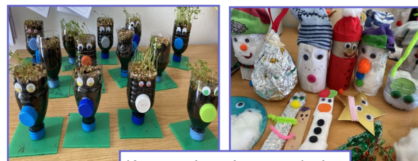
Κατασκευές με άχρηστα υλικά

• Τοποθέτηση κάδων ανακύκλωσης χαρτιού και PMD, με το λογότυπο του σχολείου μας, σε αίθουσες διδασκαλίας.