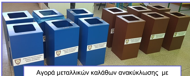
Αγορά μεταλλικών καλάθων ανακύκλωσης με

στην περιβαλλοντική εκπαίδευση, σε υποδομές και στην ανάπτυξη καινοτόμων τεχνολογιών και δράσεων. Φέτος, με το ποσό που συλλέξαμε, από τη συμμετοχή του σχολείου μας στο πρόγραμμα «Τηγανοκίνηση», προμηθευτήκαμε κάδους ανακύκλωσης με το λογότυπο του σχολείου μας (κάδοι χαρτιού και ΡΜΔ). Οι κάδοι τοποθετήθηκαν στις αίθουσες διδασκαλίας, για να ενισχυθεί η προσπάθεια ανακύκλωσης πλαστικού, αλουμινίου, χαρτιού, καθώς επίσης και η προσπάθεια μείωσης του οικολογικού αποτυπώματος του σχολείου μας.