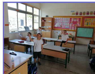
Εορτασμός 28ης Οκτωβρίου