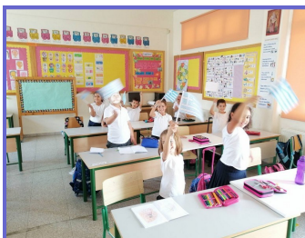
Εορτασμός 28ης Οκτωβρίου