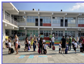
Υποδοχή μαθητών Α' τάξης