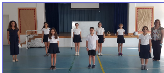
Το ΚΜΣ του σχολείου μας με τις υπεύθυνες Β.Δ.

1.Εκλογές μαθητικών συμβουλίων σε όλες τις τάξεις και στη συνέχεια εκλογή του Κεντρικού Μαθητικού Συμβουλίου . Το Κ.Μ.Σ. συνέρχεται σε τακτές συνεδρίες, συζητά τρέχοντα θέματα, καθορίζει στόχους και τη γενικότερη πολιτική και δράση του. Ανακοινώνει στους μαθητές τις αποφάσεις του.