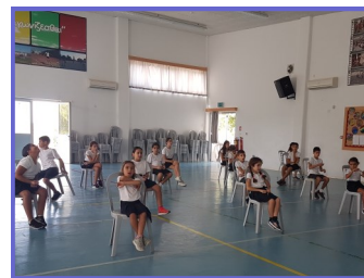
Διαδικασία εκλογής ΚΜΣ